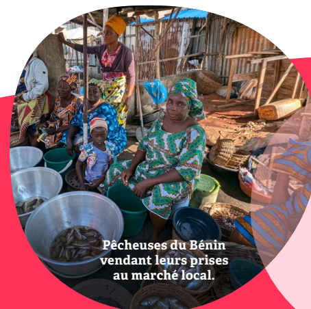
Pêcheuses du Bénin vendant leurs prises au marché local.

En 2025, notre impact s'étendra sur 11 pays où nous soutiendrons plus de 71000 personnes. Notre vision de la coopération est fondée sur des valeurs inclusives, féministes, écologistes, décoloniales 1 et antiracistes.