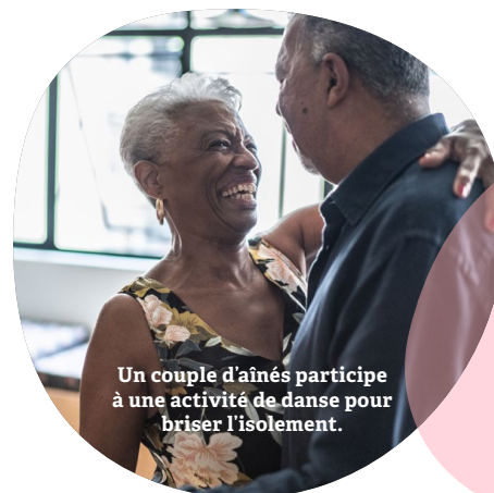
Un couple d'aînés participe à une activité de danse pour briser l'isolement.

Ce projet soutiendra 26 familles et offrira aux personnes proches aidantes un moment essentiel de repos.