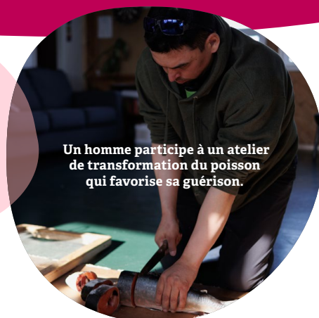
Un homme participe à un atelier de transformation du poisson qui favorise sa guérison.

Il soutient la guérison des traumatismes et des dépendances, permettant à chaque membre de la famille de se retrouver ensemble sur le chemin de la réconciliation et du bien-être.