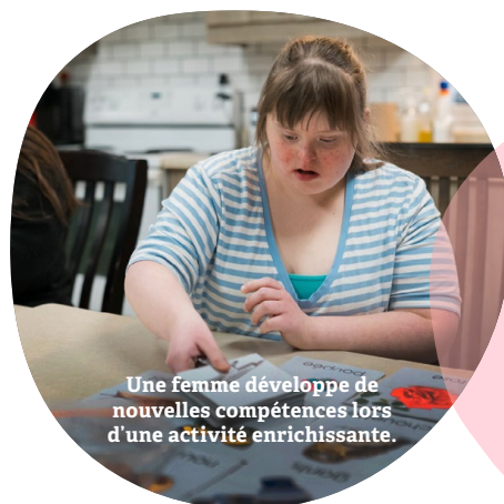
Une femme développe de nouvelles compétences lors d'une activité enrichissante.