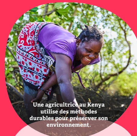
Une agricultrice au Kenya utilise des méthodes durables pour préserver son environnement.

Grâce à ce programme, nous renforçons notre présence au Bénin et en Bolivie, pour les prochaines années, en soutenant des initiatives qui placent les communautés locales au cœur des solutions durables.