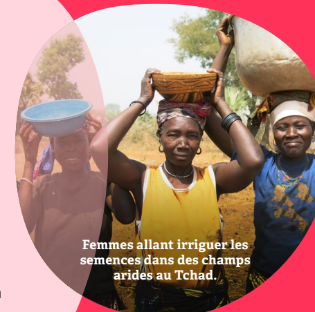
Femmes allant irriguer les semences dans des champs arides au Tchad.

Au Tchad, le projet RCIM 2 accompagne des productrices agricoles de différentes générations dans l'adoption de pratiques respectueuses de l'environnement, améliorant ainsi la sécurité alimentaire et le pouvoir économique des femmes et de leurs familles.